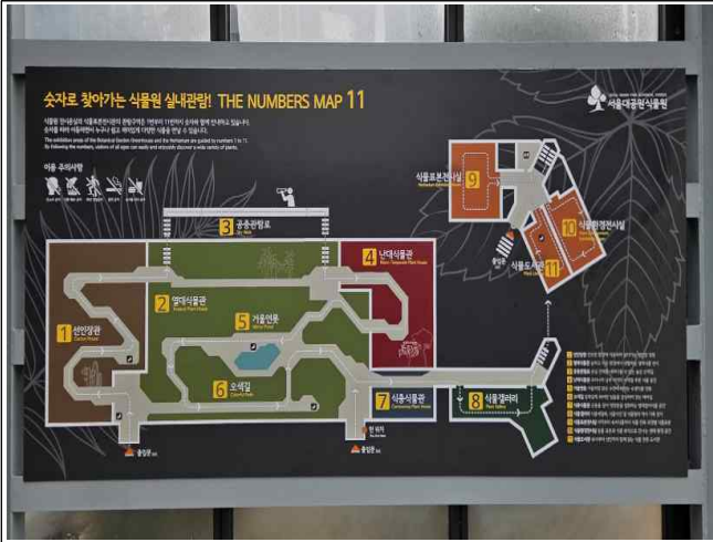
전시관 명칭 재정립