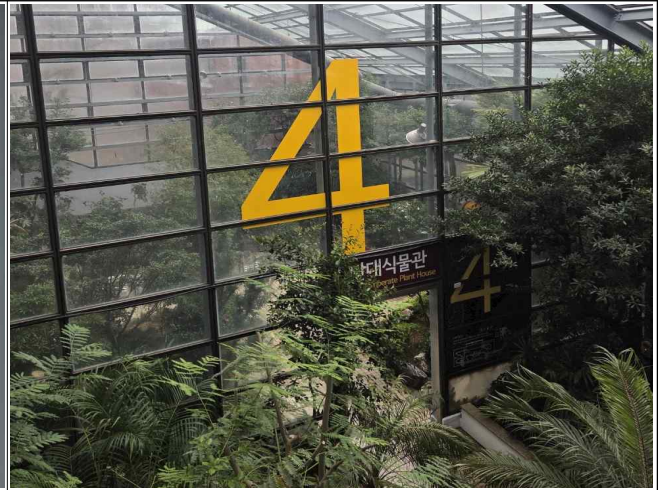
숫자형 동선 안내체계 도입