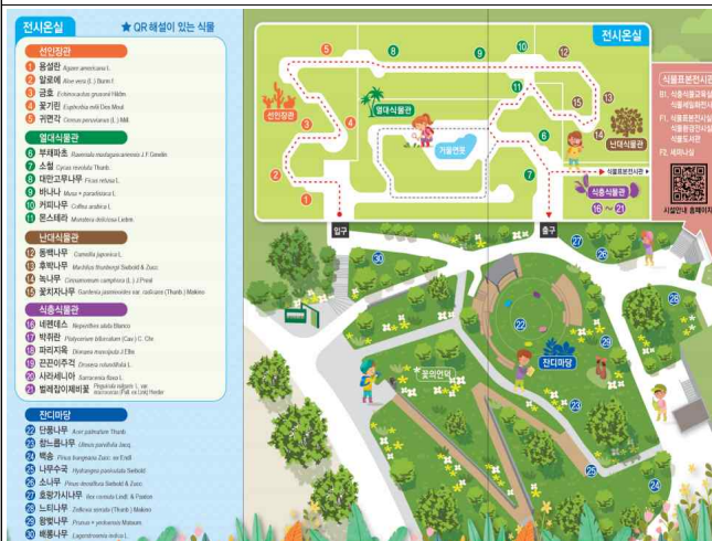
나혼자 식물원 투어! 지도