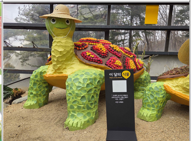
이달의 식물 안내