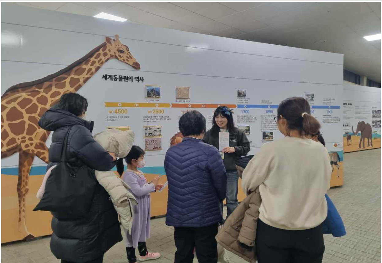
동물해설사가 동물원 역사존에서 해설하는 모습