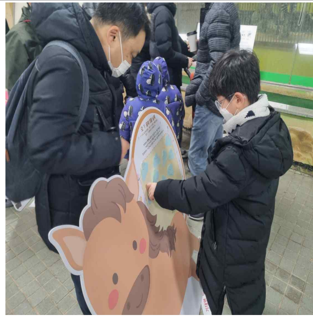
말 등신대에 새해 덕담 붙이기