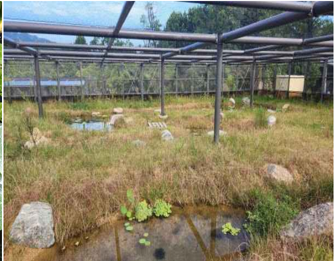
사진4_서울대공원 양서류 특화 증식장(야외)