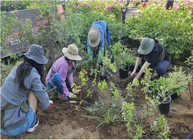
주말 N가든(1년 릴레이 정원 만들기)